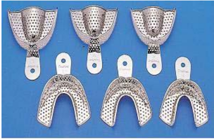
レギュラートレイ