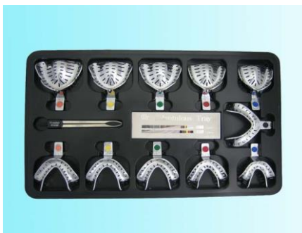
シュライネマーカートレイ