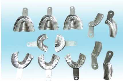
アルミトレイセット