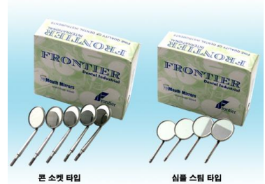
ミラートップ拡大鏡 2.5X