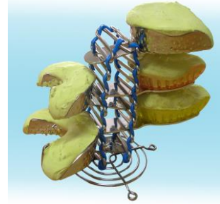
トレイホルダー赤青 2500円