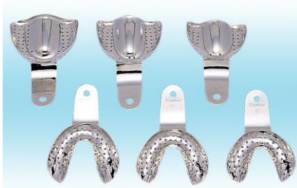
無歯顎トレイ 1個 2100円