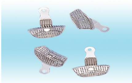
回転トレイ 1個 1450円