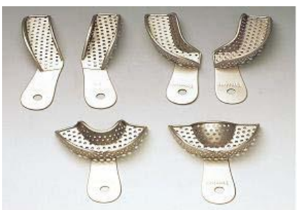
パーシャルトレイ